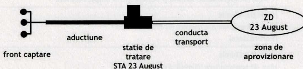
DIAGRAMA DE FLUX - ZONA DE DISTRIBUȚIE 23 AUGUST (ZD - 23 AUGUST)